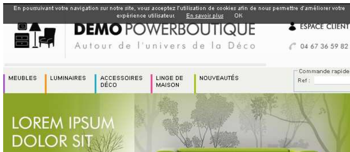
Exemple de bandeau d'information (aperçu du widget « Bandeau Cookies » PowerBoutique)

2) mise en place d'une page « En savoir plus » permettant d'informer clairement l'internaute sur :